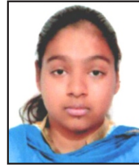
HEMA BCA. , SEM.-3RD