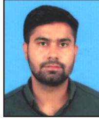
PARAS BCA , SEM.-5TH