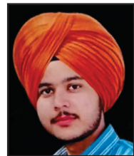
MANMOHAN SINGH +2 ARTS